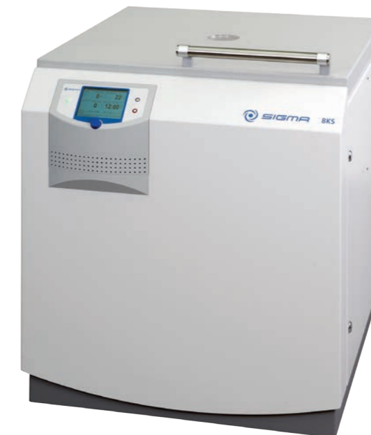
Sigma 8KS / 8KBS